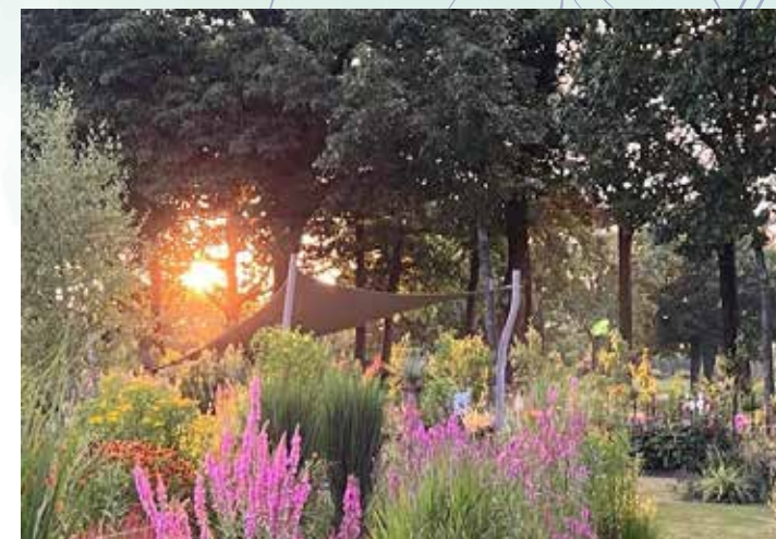
Pluktuin De Peel, Kanaalweg 6a Griendtsveen

Tuinen zijn open van 11.00 tot 17.00 uur Voor meer informatie, zie ook de websites Gratis toegang