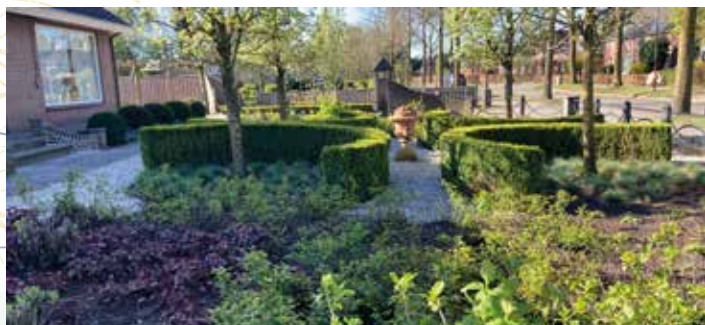
Brand 19, Zeeland

2. Rozannie's Hof, Goordonksedijk 10, 5464 TE Mariaheide. Rondom deze langgevelboerderij uit 1880 bevinden zich een drietal totaal verschillende tuinen met ieder een eigen thema. Een vijfvertuin, heidetuin en een vaste planten en grassentuin. Heel veel soorten buxus (uit een kwekerij verleden) in allerlei vormen maakt dit plaatje compleet. Met een totale oppervlakte van 3000m2 een bijzonder geheel met een romantische uitstraling. Zeker een bezoek waard!