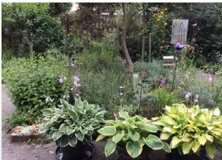
Dennerode 12, Helmond

6. Buurttuin "in 't veld", Oude Torenstraat 5708 CP Helmond (Stiphout). In Stiphout ligt buurttuin In 't Veld. Een buurttuin waar iedereen mee mag genieten door deelname aan activiteiten. Elk seizoen wordt gevierd. Het is een ontmoetingsplek voor en door de buurt, gerund door enthousiaste vrijwilligers. In de buurttuin vind je een moestuin, kruidentuin, fruitbomen, struiken en een bloementuin. De tuin ligt aan een zandpad bij de oude toren in Stiphout.