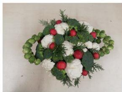
Hier enkele impressies.